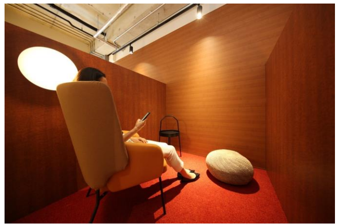
△共用スペース リラックスシート