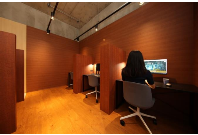
△共用スペース 半個室席