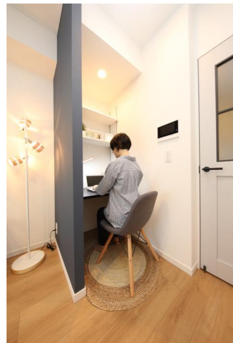
△1K住戸内ワークスペース

物件HP https://solaie.jp/ill-chintai/koshigaya-gamo/